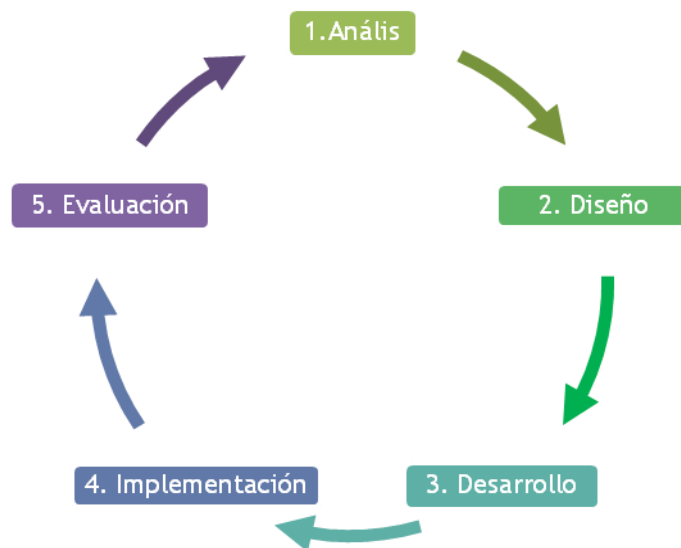
Figura 1: Modelo de Diseño Instruccional ADDIE

El Modelo de Diseño Instruccional ADDIE comprende cinco fases: Análisis, Diseño, Desarrollo, Implementación y Evaluación (Figura 1). En el contexto de la presente comunicación se exponen las tres primeras fases.